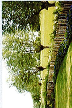
Côture de type ganivelle en bois, implantées en limites séparatives des jardins privés.