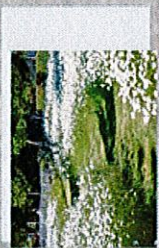
Aire de jeux (Construction printemps 2024)