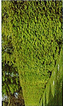
Haies composées de Charme Commun, implantées en limites séparatives des jardins privés.