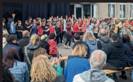
La fête des écoles le 14 juin, merci aux représentants de parents d'élèves et aux enseignant(e)s.