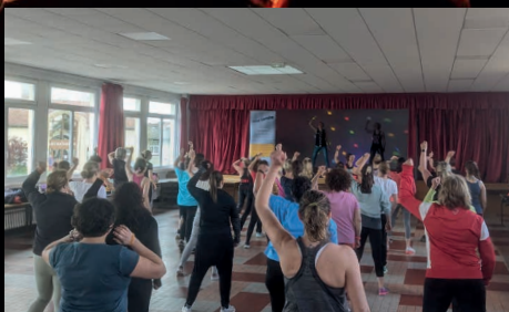
Pour les sportives, il y a eu de la Zumba le 20 avril organisée par le GYM CLUB en partenariat avec Ennergy'z fit.