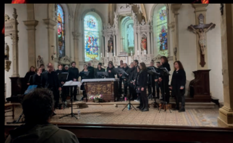
Le 21 avril, le Conseil de Fabrique nous a offert un moment musical avec l'ensemble Leszynki.