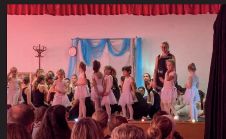
La fête de la musique a débuté avec un spectacle de New Temps danse qui s'est finalement déroulé au foyer pour des raisons climatiques.