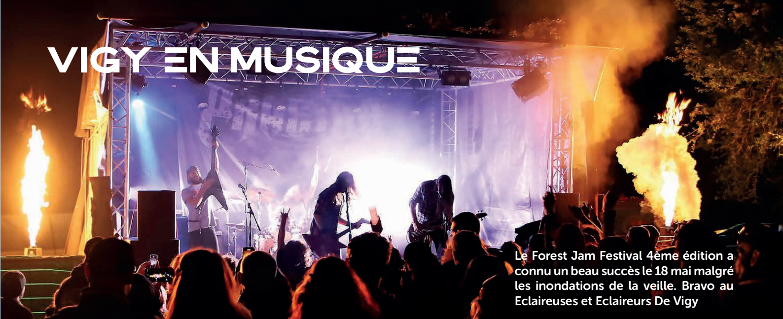
Le Forest Jam Festival 4ème édition a connu un beau succès le 18 mai malgré les inondations de la veille. Bravo au Eclaireuses et Eclaireurs De Vigy