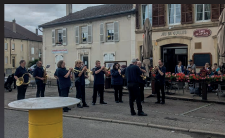
Merci à notre Fanfare pour le concert à la maison de retraite suivi de l'aubade devant le café de la place.