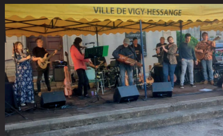
Le 22 juin, pour fêter ses 60 ans, le Groupe Sans Gain a ambiancé notre place avec leurs amis du goupe Galadriel.