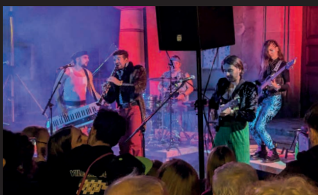
La guigette Boukrave, pour sa 4ème édition, a enchanté plus de 800 personnes sur notre place de l'église le 25 mai.