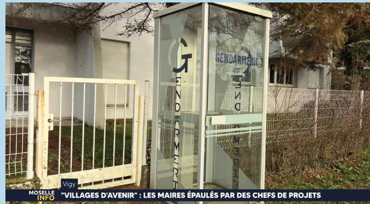
MOSELLE INFO "VILLAGES D'AVENIR" : LES MAIRES ÉPAULÉS PAR DES CHEFS DE PROJETS

Cela nous permettra d'entamer plus rapidement que prévu les travaux de ce lieu. Toutefois, les délais administratifs étant malheureusement longs, la projection d'avoir des commerces et notamment une boulangerie en fonction est à l'automne 2025 . Un reportage sur ce sujet est disponible sur le site de Moselle TV.